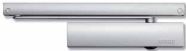
Der neue GEZE TS 5000® Ecline® mit Gleitschiene